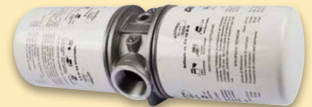
Filtre de retour pour montage en ligne.