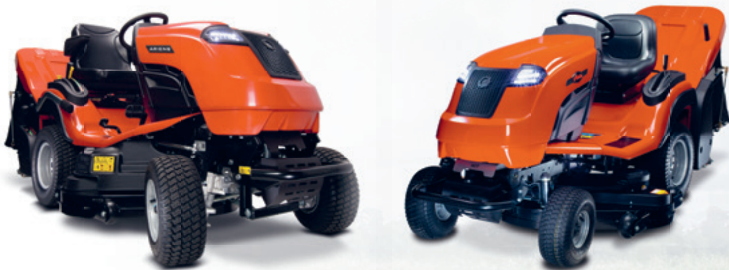
Abb. mit XRD-Mädeck und RPC+Aufnahmesystem

Das einzigartige Allradsystem 4TRAC verwandelt den Rasentraktor von Ariens in ein Nutzfahrzeug, das überall hinkommt, überall mähen kann und in der Lage ist, Hänge und unwegsames Gelände zu bewältigen. Der Allradantrieb erweitert den Nutzen des Traktors noch weiter. Mit einer B-Serie können Sie Ihren Ariens an Orte bringen, an denen es für die meisten Rasentraktoren nicht mehr möglich ist zu fahren. Mähen Sie auch an Hängen sicher, für deren Bearbeitung zuvor ein Freischneider erforderlich war. Ziehen Sie einen Anhänger durch ein Wäldchen oder räumen Sie den Schnee von Ihrer Auffahrt.